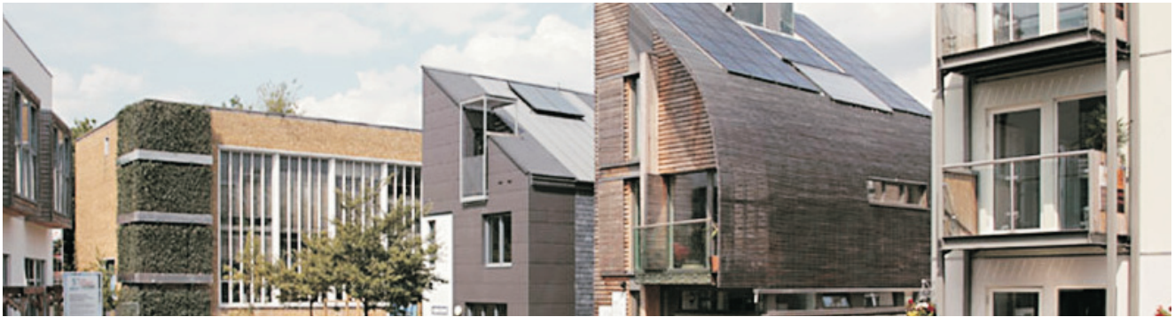
BRE "Innovation Park" - Watford, England