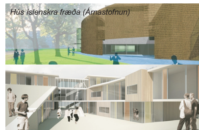
Framhaldsskólinn í Mosfellsbæ

Meðal verkefna sem AV hefur unnið að er hús Náttúrufræðistofnunar Íslands en það er eitt af fyrstu mannvirkjum hér á landi sem mun hljóta alþjóðlegu BREEAM umhverfsvottunina. Markmiðið með notkun BREEAM er að lágmarka neikvæð umhverfisáhrif byggingarinnar og stuðla að sjálfbærni.