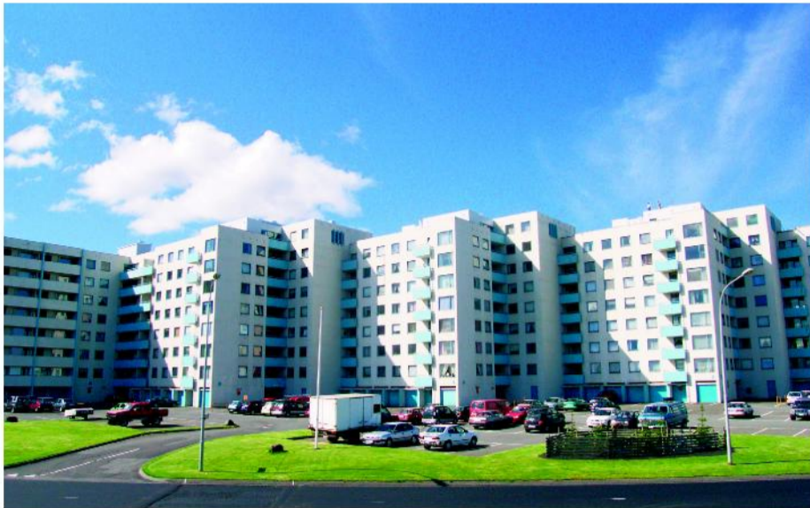
Asparfell 2-12 - Viðhald utanhúss

Almenna verkfræðistofan hf. hefur haft veg og vanda að hönnun og undirbúningi viðhalds á sameign Asparfells 2-12 að utan. Verkefnið er með því stærsta sem boðið hefur verið út á vegum húsfélags á landinu, enda er um að ræða stærsta húsfélag landsins, með 192 íbúðir og yfir 500 íbúa.