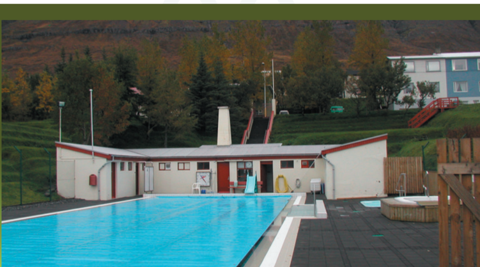
Sundlaugin á Neskaupstað.