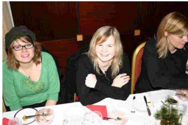
Frá jólahlaðborði starfsmanna

Almenna verkfræðistofan bauð starfsmönnum sínum í hádegis jólahlaðborð á Hótel Loftleiðum, föstudaginn 9. des sl. Mjög góð mæting var og var ekki annað að sjá en að starfsmenn hefðu mætt hungraðir til leiks og farið mettir til baka.