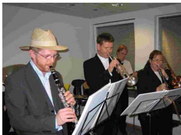
Dixielandfélagið var hljómsveit kvöldsins

Starfsmenn gerðu sér glaðan dag í boði AV og fögnuðu komandi vetri, að hætti hússins, og mikið var um dýrðir. Dixielandfélagið var hljómsveit kvöldsins og boðið var upp á Kínafóður að austurlenskum sið. Farið var í nokkra leiki og síðan var sungið og trallað fram á kvöld.